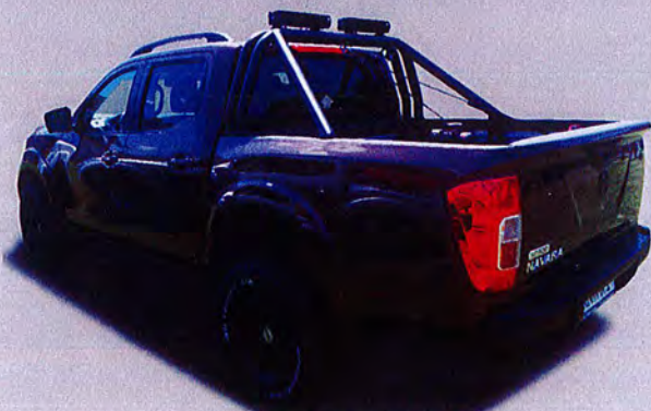
Bügelsystem mit Ladungs-Seilwinde