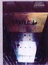
Unterfahrschutze aus 6 mm Aluminium