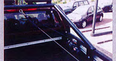
Ladungswinde WARN 1,2 t