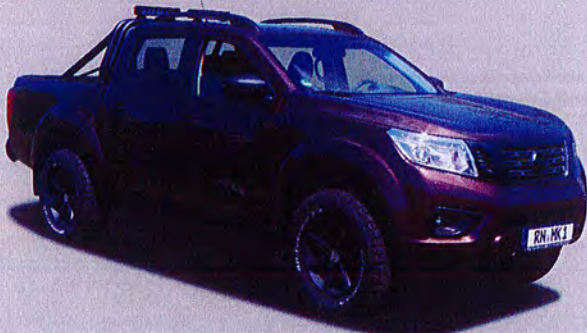
Fahrwerkshöherlegung +3,5 cm,Bodyliftkit + 8cm und Auflastung auf 3,5 Tonnen