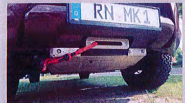
Front-Seilwinde WARN 5,4 t